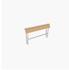
Landi Stehbank lang