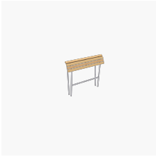
Landi Stehbank kurz